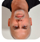
Fungerar bra bredvid jobbet

Innan vi gick kursen tog det ungefär 49 minuter att producera en nullsol. Nu med den ökade effektiviteten han hitills undervisar drygt 5 200 medarbetare från och med utvecklingsfrågor i Rwanda